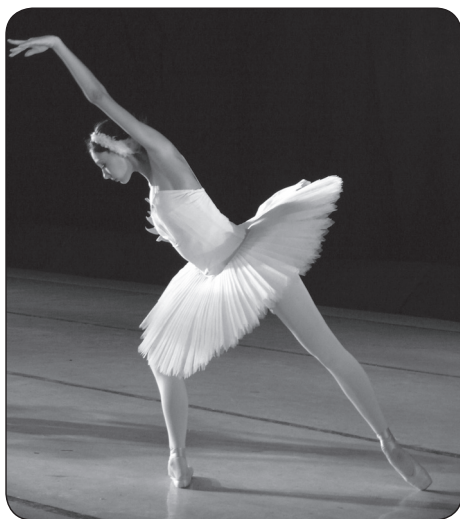
Днепропетровский Академический театр оперы и балета.

Погоня за лебединой стаей продолжалась очень долго. Уставшие спутники принца давно повернули назад, и только Зигфрид настойчиво продолжал свой путь. Какая-то неведомая сила влекла его все дальше и дальше. Неожиданно лес расступился, и юноша оказался на берегу большого красивого озера. В волшебном свете яркой луны он увидел белых лебедей, превратившихся в прекрасных юных девушек. Одна из них — с маленькой короной на голове — принцесса Одетта . Она рассказывает юноше о том, что ее и подруг заколдовал злой чародей — черный филин. Свой настоящий облик девушки могут принимать лишь ночью, но с первыми лучами утренней зари они вновь превращаются в белых лебедей.